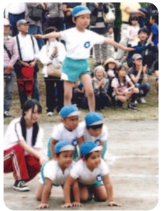
「運動会」ピラミッド

【チャリティコンサート】「被災児童を励ます会」と満足そうでした。演奏会場付近には、生徒会役員の生徒が募金箱をもって立ち、募金の呼びかけをしました。小さな子どもたちから、お年寄りまで多くの方が募金に協力してくださいました。3日間を通して集まった義援金は、日本赤十字社を通して被災地に送りました。