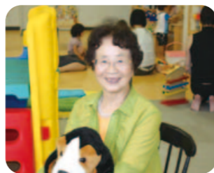
写真：相談支援室にて

最近、紙芝居の舞台を特注で作りました。学生時代に敗戦後の焼け跡の子もたちを訪ね、人形劇、紙芝居、お話をしました。児童文化研究会で技を磨き合い、人形劇は公会堂で、紙芝居は各地の公園で、担当の母子寮へは毎週欠かさず4年間通いました。教育に携わり50数年、これからも夢を追います。