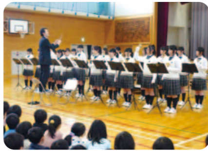
【被災児童を励ます会】ハンドベルで「ふるさと」を演奏