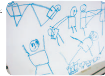
「くみ体操」 「おともだちとギュッと手をつないだよ」