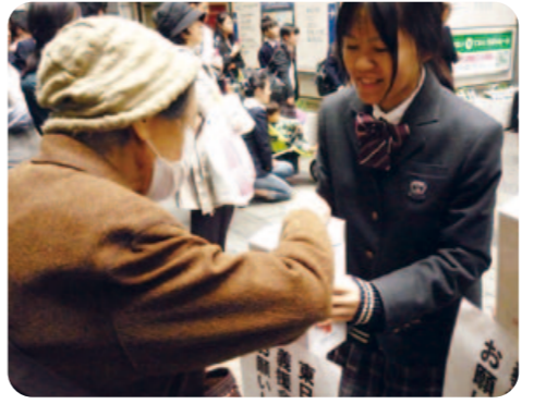
【チャリティコンサート】たくさんの善意が集まりました

ボランティア部が復興支援の募金を呼びかけました。多くの子どもたちや保護者からたくさん集まりました。なかには家から持って来た1円や5円がたくさん入ったペットボトルをそのまま募金する子どももいました。ご協力ありがとうございました。