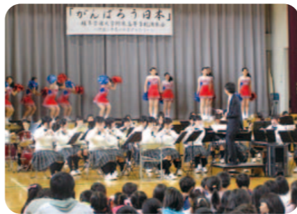
【被災児童を励ます会】吹奏楽部とバトントワリング部のコラボレーション

3クラスしかない小さな幼稚園ですが、その利点を活かして今日もいろいろな遊びや活動が展開されています。