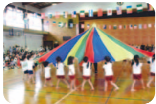
運動会「ハラバルーン」

また、園児たちにとっては、友達や家族、先生たちと一緒にうれしさや悔しさを味わい、一人ひとりの力を出し合って協力して作り上げた競ったことは、これからの成長過程で大きく影響していくことと思います。今でも遊びのなかでリレーや他クラスのダンスをしたりと、余韻を味わっている姿が見られます。学年の小さい園児たちは、「大きくなったらあんなことができるようになるんだね」「あんな風になりたい」等々あこがれの気もちを抱き、年長児はその手本となるように自覚をもって生活していくようになりま。実りの秋にふさわしく、子どもたちが成長していくように思います。