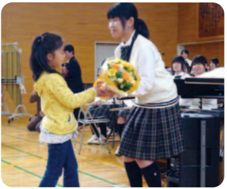
【被災児童を励ます会】お礼に花束をいただきました

【チャリティコンサート】東日本大震災の被災者を支援しようと、千葉市内の私立高校3校の吹奏楽部が5月4日(水)～6日(金)までの3日間、JR千葉駅前チャリティコンサートを開きました。4日の敬愛学園高校、5日の千葉経済大学附属高校に続き、最終日には本校吹奏楽部が演奏しました。吹奏楽部34名がデイズ・ニードレーなど8曲を演奏し、多くの方が足を止めて聴いてくださいました。