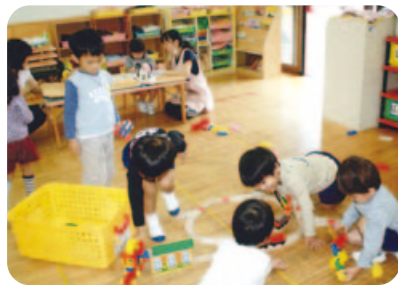
楽しそうだね「仲間に入れて!」