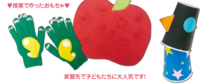
実習先で子どもたちに大人気です!