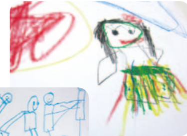
4歳児が踊った「アロハ・エ・コモマイ」 「今度は年長さんに教えてあげるネ」