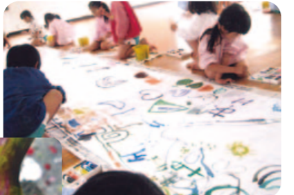
「造形教室」全員で仕上げる壁画