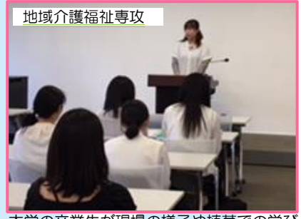
地域介護福祉専攻 本学の卒業生が現場の様子や植草での学びを語ってくれました。