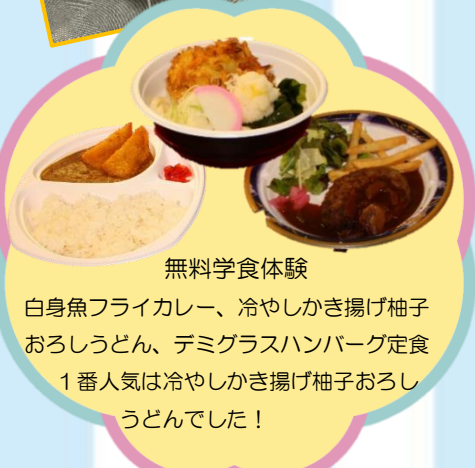
無料学食体験 白身魚フライカレー、冷やしかき揚げ柚子 おろしうどん、デミグラスハンバーグ定食 1番人気は冷やしかき揚げ柚子おろし うどんでした!

教職員・学生がみなさんの質問にお答えします。 気になることはなんでも聞いてちょう!