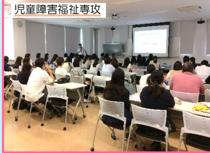
児童障害福祉専攻 教員から専攻の特色や学校での学び、特色など説明しました。