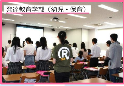
発達教育学部 (幼児・保育) 学生と一緒に保育現場で活用する手遊びを実際に体験しながら学びました