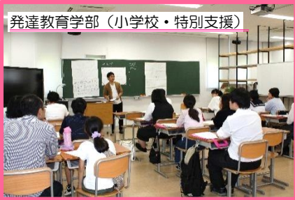
発達教育学部 (小学校・特別支援) 学生による小学校理科の実験を伴った模擬授業を行いました。