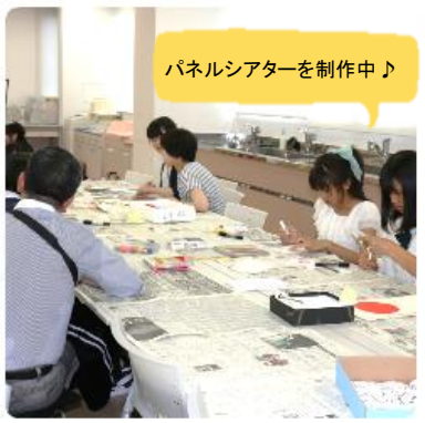
パネルシアターを制作中♪