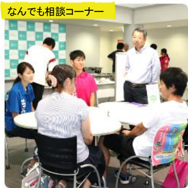
なんでも相談コーナー