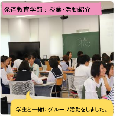
発達教育学部：授業・活動紹介