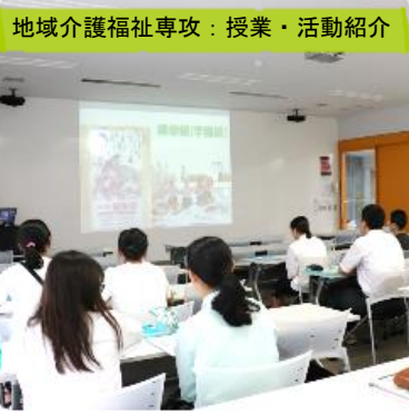
地域介護福祉専攻：授業・活動紹介