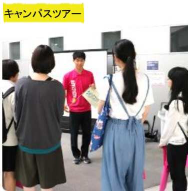
キャンパスツアー