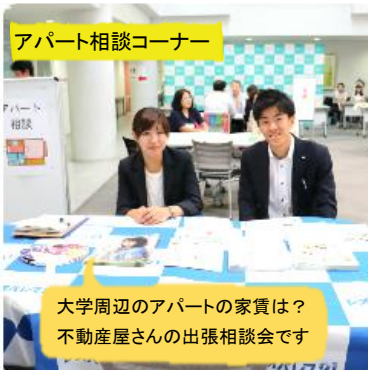
アパート相談コーナー