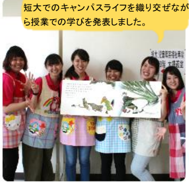
短大でのキャンパスライフを織り交ぜながら授業での学びを発表しました。