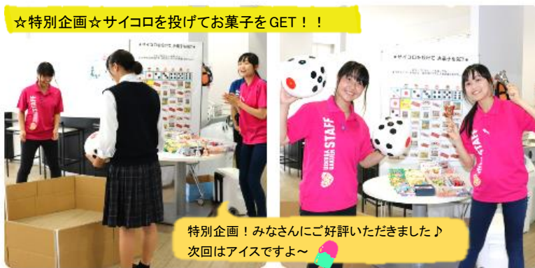
☆特別企画☆サイコロを投げてお菓子をGET！！