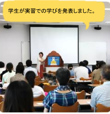
学生が実習での学びを発表しました。