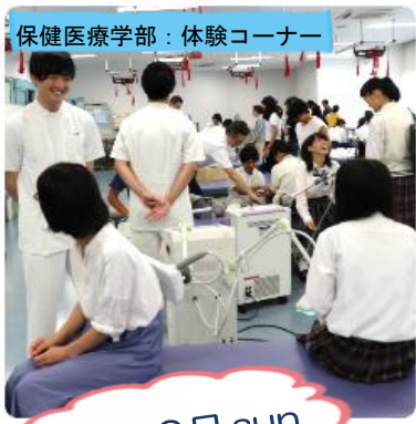
保健医療学部：体験コーナー