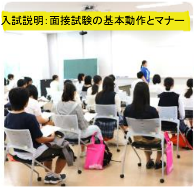
入試説明：面接試験の基本動作とマナー