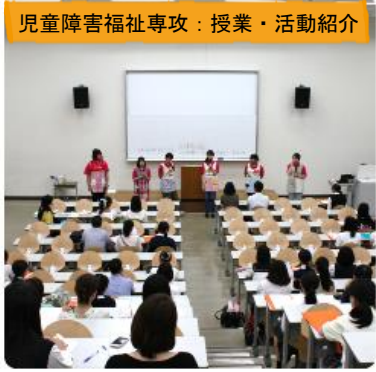
児童障害福祉専攻：授業・活動紹介