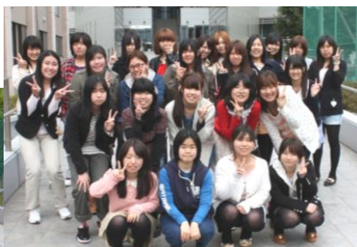
植草学園大学附属高校出身の 1 年生