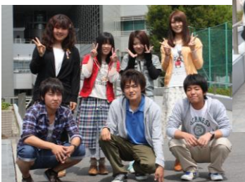
大多喜高校出身の 1 年生