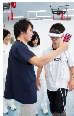
理学療法 片麻痺体験