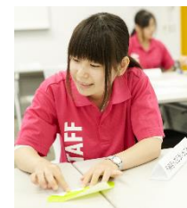
特別支援 発達障害を疑似体験