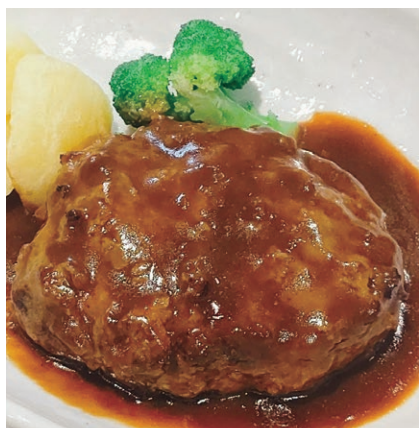
※写真は日替わり定食の一例です。