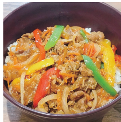
※写真は日替わりスナックの一例です。