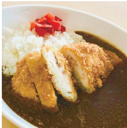
※写真は日替わりカレーの一例です。