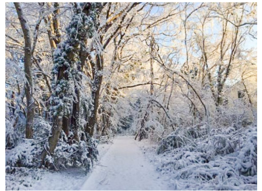
「共生の森」雪の翌朝

自然観察や環境学習の場として本学敷地内に併設されている「植草共生の森（ビオトープ）」が、ネイチャーポジティブの実現に向けた取組の一つである「自然共生サイト」として、環境大臣認定を受けました。これにより、私たちのこの森は、生物多様性条約で示された“30by30”の目標達成に向けた OECM（国立公園などの保護地域以外で生物多様性保全に資する地域）として認められ、国際データベースに登録されました。