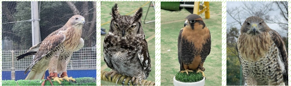
協力：エキゾチックアニマル鷹の庵