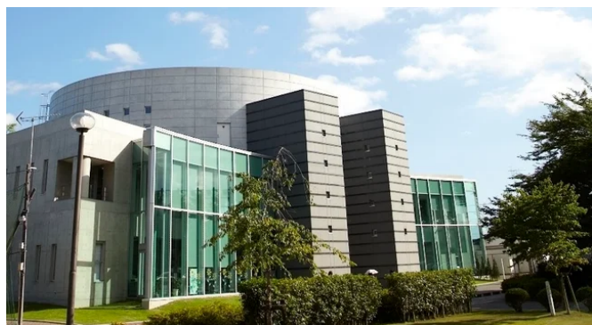
M棟 Media Gate