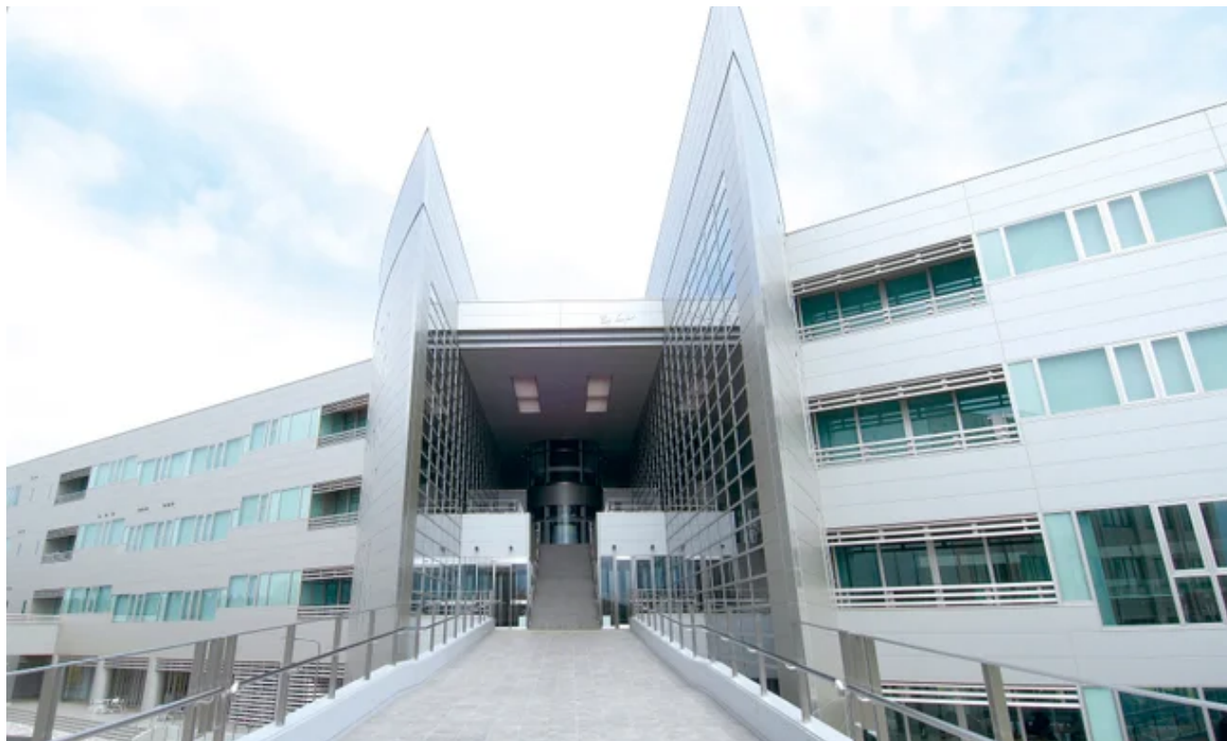
植草学園大学 千葉若葉キャンパス（千葉市若葉区）

新校舎は国立病院機構千葉医療センター附属千葉看護学校（千葉市中央区椿森）の跡地です。同センターをはじめ、千葉県内の国立病院機構4病院と連携を図り、高い専門性と実践力を持つ看護師を育成します。