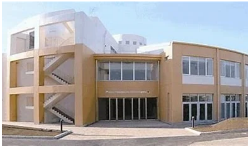
千葉医療センター内樁森キャンパス（千葉市中央区）