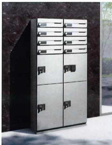
■ 郵便ポスト・宅配BOX