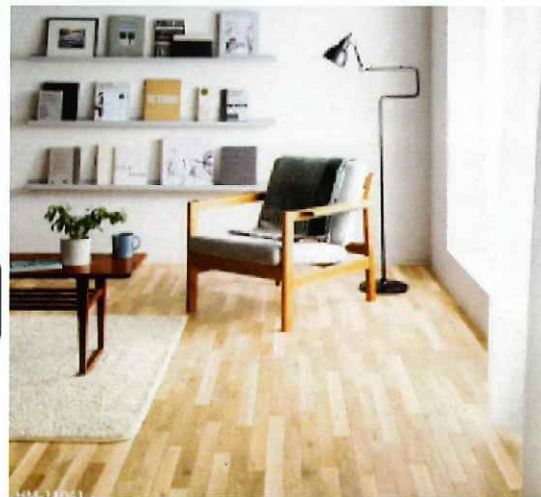
■ 内装イメージ (例)